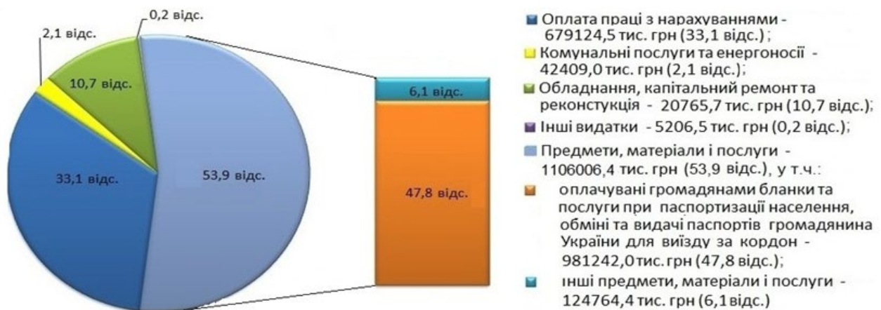
Діаграма 2. Структура витрат на забезпечення діяльності ДМС у 2015 році та за 9 місяців 2016 року

У цілому, визначена ДМС потреба в асигнуваннях загального фонду у 2015 – 2016 роках забезпечувалась на рівні від 47,5 до 50,4 відсотків. Так, при обрахованій ДМС у бюджетних запитах потребі на 2015 рік – 1095129,7 тис. грн, на 2016 рік – 1808009,4 тис. грн затверджено 552377,0 і 858308,6 тис. грн, відповідно.