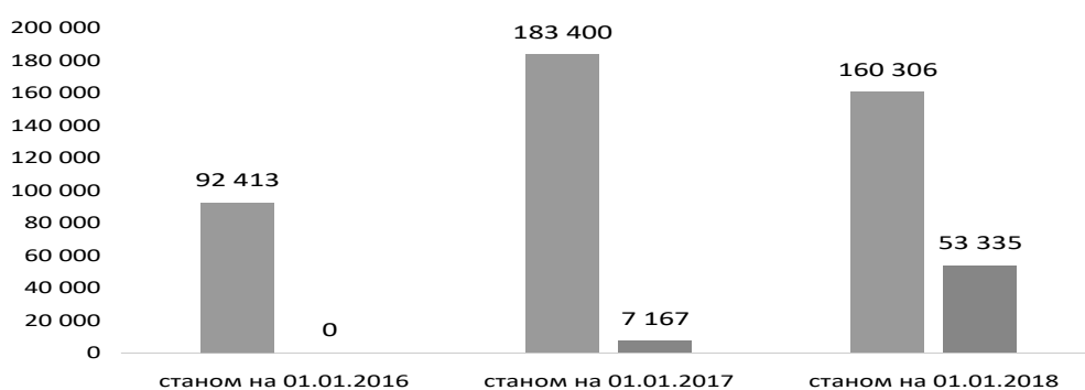
Діаграма 3. Кількість судових рішень, віднесених до першої черги погашення заборгованості за рахунок бюджетної програми 3504040

На діаграмі 3 простежується динаміка зростання протягом 2015–2017 років кількості виконаних судових рішень. У 2015 році не забезпечено виконання жодного рішення суду, у 2016 році виконано 7 167 рішень, у 2017 році – 53 335. Проте у співвідношенні із судовими рішеннями, що надійшли, виконання рішень становило 4 і 33 відс. відповідно.