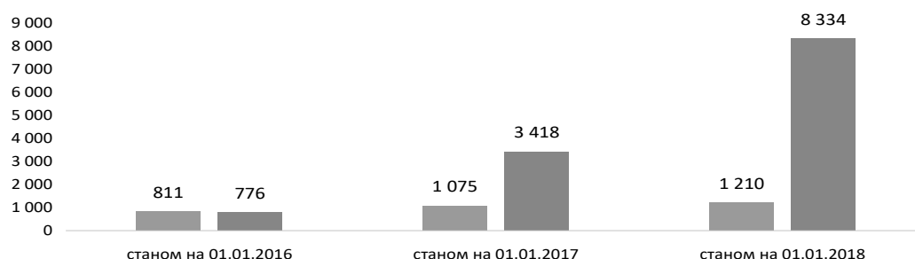
Діаграма 4. Кількість судових рішень, віднесених до другої і третьої черги погашення заборгованості за рахунок бюджетної програми 3504040

Діаграма 4 відображає динаміку значного зростання протягом 2016–I кварталу 2018 року кількості судових рішень, віднесених до третьої черги погашення за рахунок бюджетної програми 3504040, – 776 рішень станом на 01.01.2016 до 8334 станом на 01.01.2018. Станом на 05.03.2018 вже обліковувалося 8 552 рішення.