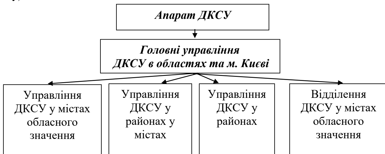
Схема. Організаційна структура ДКСУ

Організаційна структура ДКСУ на час аудиту мала такий вигляд (дивись схему).