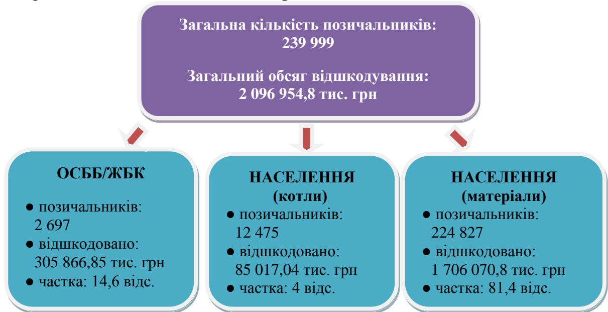
Схема. Розподіл відшкодування частини суми кредиту між населенням та ОСББ/ЖБК

Так, протягом періоду, що досліджувався, відшкодовано населенню 1 791 087,84 тис. грн, з яких 1 706 070,8 тис. грн – на придбання обладнання і матеріалів та 85 017,04 тис. грн – на придбання котлів та обладнання і матеріалів до них, 305 866,85 тис. грн – ОСББ/ЖБК.