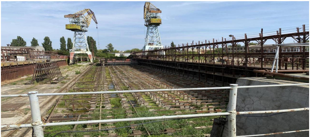
Рис. 2. Недобудований плавучий залізобетонний композитний док, проєкт 1760 кр

Основні характеристики: багатоцільовий транспортний рефрижератор. Дальність плавання - 12000 миль, кількість ліжкових місць – 28, валова місткість - 10069 т, дедвейт - 11070 т, місткість рефтрюмів - 14000 куб., контейнерна місткість - 324 TEU, довжина - 148,0 м, ширина - 21,6 м, висота борту - 13,1 м, осад - 9,50 м, потужність головного двигуна - 1 x 15 600 к.с., швидкість - 19,8/21,0 узлів.