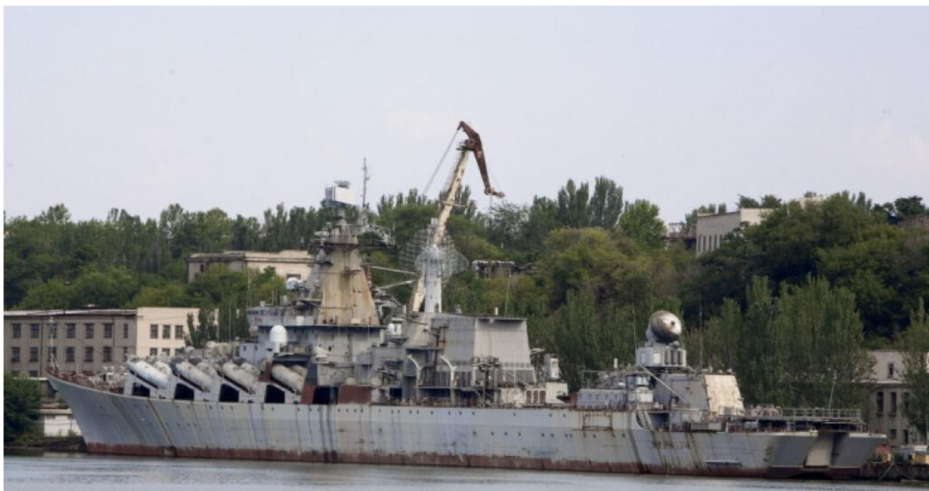
Рис. 1. Ракетний крейсер проєкту 1164 «Україна»

Основні характеристики: ракетний крейсер, водотоннажність – 11280 т, довжина – 186 м, ширина – 20,8 м, осадка – 8,4 м, двигуни: ГЕУ газотурбінна: 2 ГТА М-21 по 71000 к.с. кожний та ЕЕУ 6 турбогенераторів по 1500 кВт і 6 по 1250 кВт, швидкість повного ходу – 32,5 вузлів, дальність плавання – 7500 миль, екіпаж – 485 ос., озброєння: 1×2 130-мм АУ АК-130, 8×2 ПУ ПКРК П-500 «Базальт», 8×8 ПУ ЗРК С-300Ф «Форт», 2×2 ПУ ЗРК 4К33 «Оса-МА», 6×6 30-мм ЗАК АК-630, 2×5 533-мм ТА ПТА-53-1134, 2×12 РБУ-6000, Авіаційна група: 1 х Ка-27ПЛ1.