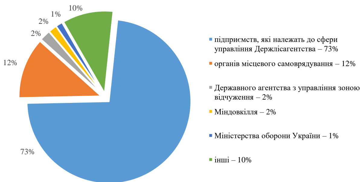
Діаграма 1. Підпорядкування лісових земель в Україні

Більше половини лісів країни створені людиною та потребують посиленого догляду. Запас деревини в лісах оцінюється в межах 2,3 млрд м 3 . За рік у лісах України в середньому приростає 35 млн м 3 деревини. Середньорічний приріст деревини на 1 га у лісах, що перебувають у користуванні лісогосподарських підприємств Держлісагентства, дорівнює 3,9 м 3 на 1 га і коливається від 5 м 3 в Карпатах до 2,5 м 3 у степовій зоні. Відбувається поступове збільшення запасу, що вказує на значний економічний і природоохоронний потенціал наших лісів. У лісах України запас на 1 га становить близько 235 м 3 , зокрема у лісах, що перебувають у користуванні лісогосподарських підприємств Держлісагентства, близько 251 м 3 (10 місце в Європі, у Польщі – 288 м 3 , Швеції – 131 м 3 ). У цілому по Україні цей показник нижчий і становить 235 м 3 за рахунок, насамперед, лісів реформованих сільгоспідприємств, які зріджені та знаходяться в складному санітарному стані 23 .