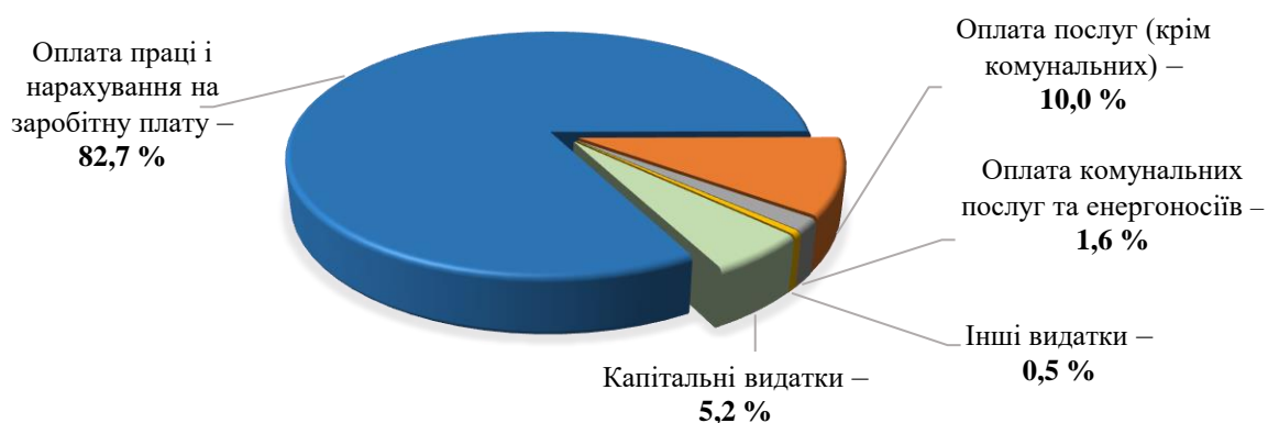
Діаграма 1. Використання Держфінмоніторингом коштів за загальним і спеціальним фондами у 2020–2022 роках

Найбільшу питому вагу касових видатків за загальним і спеціальним фондами (407 171,4 тис. грн) за 2020–2022 роки (82,7 відс.) становили витрати на оплату праці та нарахування на неї (336 599,9 тис. грн): за загальним фондом – 84,1 відс.; видатки на оплату послуг (крім комунальних) – 10,0 відс. (40 755,1 тис. грн, з яких 35 394,0 тис. грн за загальним фондом та 5 361,1 тис. грн за спеціальним фондом); на оплату комунальних послуг та енергоносіїв – 1,6 відс. (6 453,7 тис. грн, з яких 6 373,1 тис. грн за загальним фондом і 80,6 тис. грн за спеціальним фондом).