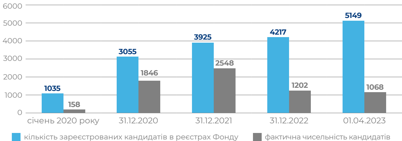
Діаграма 2. Дані щодо фактичної кількості кандидатів на отримання пільгових довгострокових кредитів та кількості зареєстрованих осіб на отримання пільгових довгострокових кредитів у реєстрах Фонду

Ці показники свідчать про завищення реальної кількості осіб у реєстрах Фонду, за якими зберігається право на отримання пільгових довгострокових кредитів. Діаграма 2 ілюструє розбіжність між фактичною кількістю кандидатів на отримання кредитів і даними реєстрів Фонду.