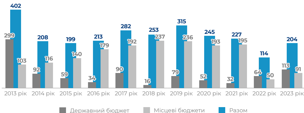
Діаграма 1. Кількість кредитів, наданих у межах Програми у розрізі джерел фінансування

Інформація про кількість кредитів, наданих у межах Програми з початку її дії у розрізі джерел фінансування, наведена на діаграмі 1.