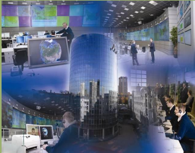
Национальный центр управления в кризисных ситуациях МЧС России