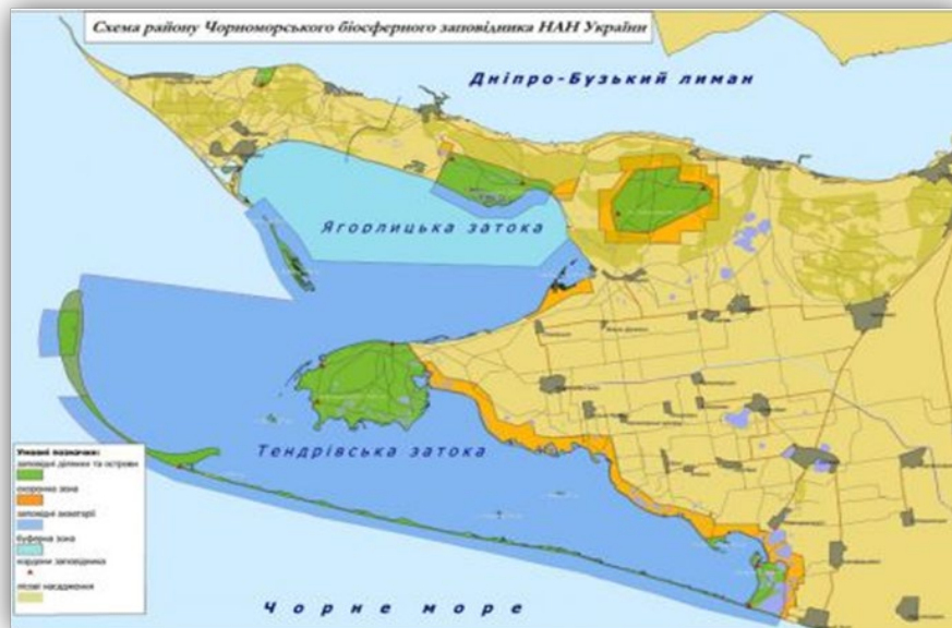
Рис. 1. Схема району Чорноморського біосферного заповідника.

Одним із найстаріших біосферних заповідників та найбільшим за територією є Чорноморський біосферний заповідник, який діє з 1927 року та включений до Всесвітньої мережі біосферних резерватів з 1985 року 2 (рис. 1).