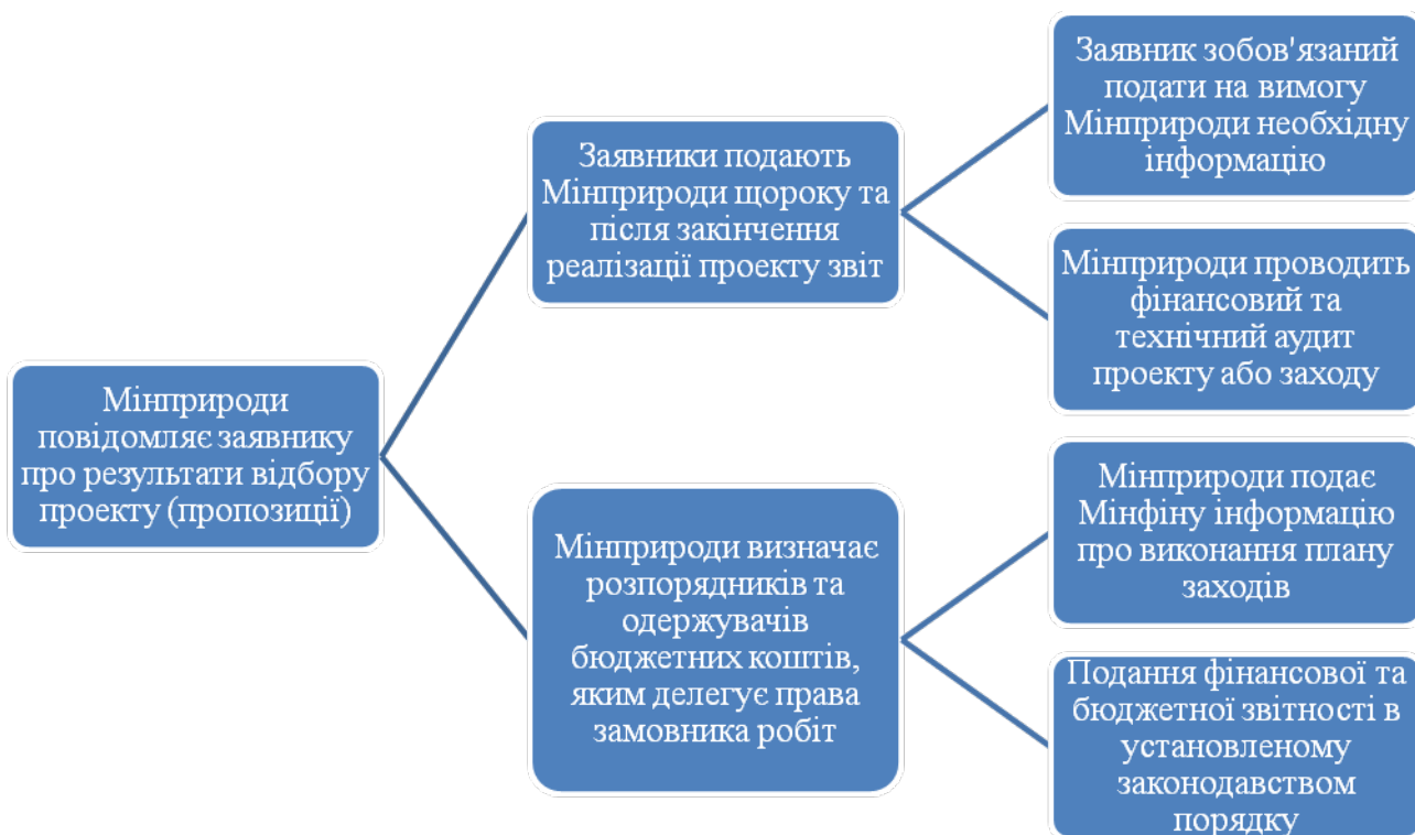
Рис. 2. Схема реалізації проектів та заходів, спрямованих на зменшення обсягів викидів (збільшення абсорбції) парникових газів

заходу згідно з вимогами договорів про продаж частин установленої кількості викидів парникових газів. Замовником послуг з проведення фінансового та технічного аудиту є Мінприроди (пункт 12 Порядку № 221).