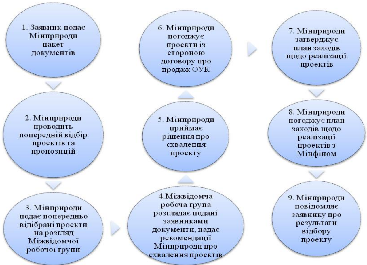
Рис. 1. Схема процесу відбору та погодження проектів і заходів для включення до плану заходів, спрямованих на зменшення обсягів викидів парникових газів