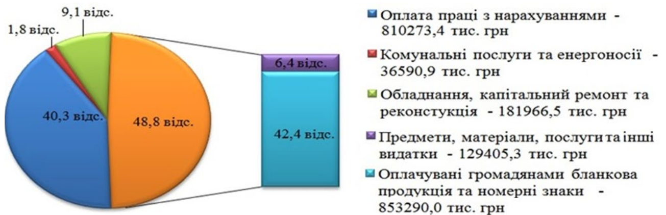
Діаграма 2. Структура витрат бюджетних коштів, виділених сервісним центрам МВС у 2016 році та за 9 місяців 2017 року

Згідно з наведеними даними, ГСЦ МВС протягом 2016 року та 9 місяців 2017 року перерахував на рахунки МВС 49418,3 тис. гривень.