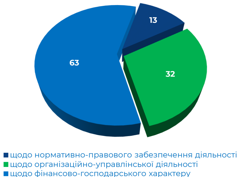
Діаграма 2. Нормативно-правові акти НАН України

Водночас для забезпечення організаційно-управлінських рішень НАН України Кабінет Міністрів України шляхом видання трьох розпоряджень реорганізував 5 два наукові заклади та передав 6 1 до сфери управління ФДМ України.