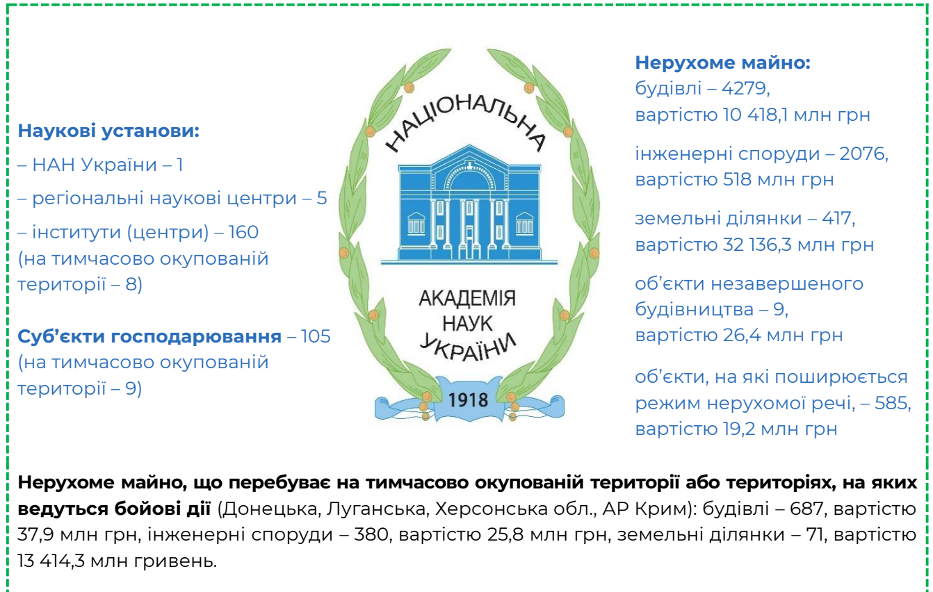
Рис. 1. Структура та майно НАН України

Цим дослідженням охоплено стан імплементації рекомендацій Рахункової палати, наданих за результатами державного зовнішнього фінансового контролю (аудиту) 2 в НАН України щодо ефективності управління об'єктами державної власності, що мають фінансові наслідки для державного бюджету (рис. 1).