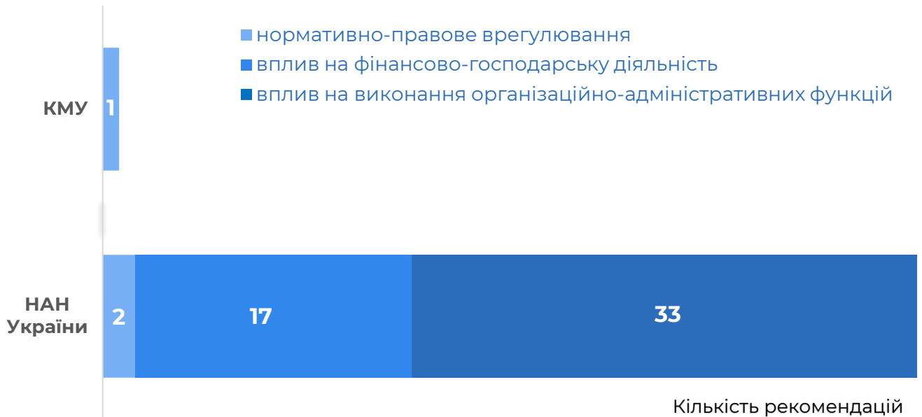
Діаграма 1. Надані рекомендації Рахунковою палатою в розрізі їх виконавців